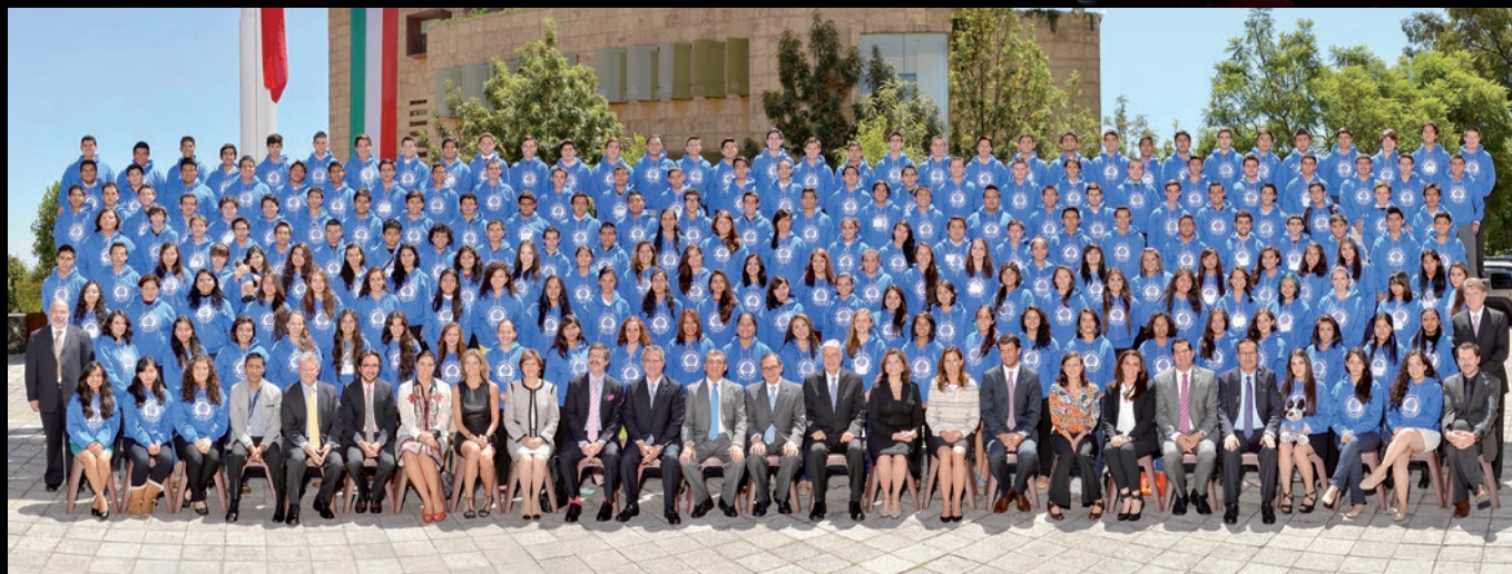
SEGUNDA GENERACIÓN 2015-2019